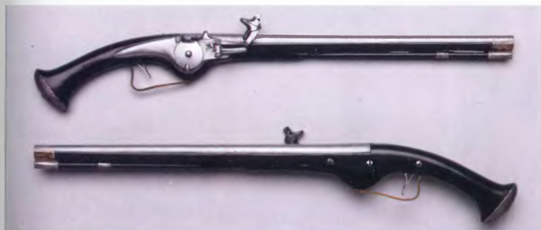
Пара седельных пистолетов. Голландия, ок. 1660