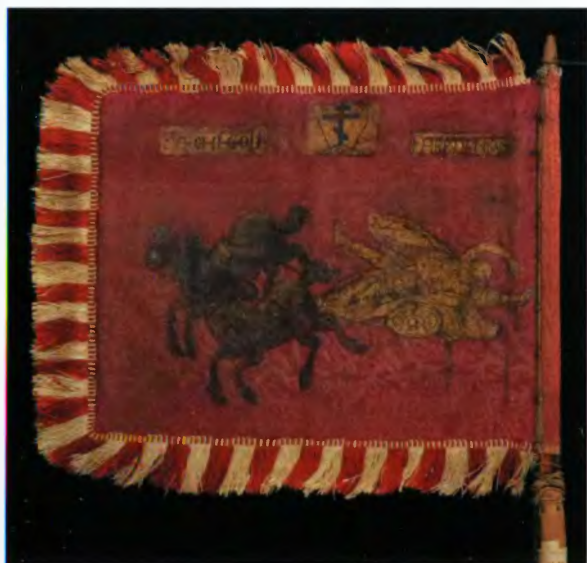
Знамена рейтарского полка Дениса Фонвизина: полковничье «белое» и ротное, 1656