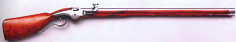
Карабин. Голландия, ок. 1660