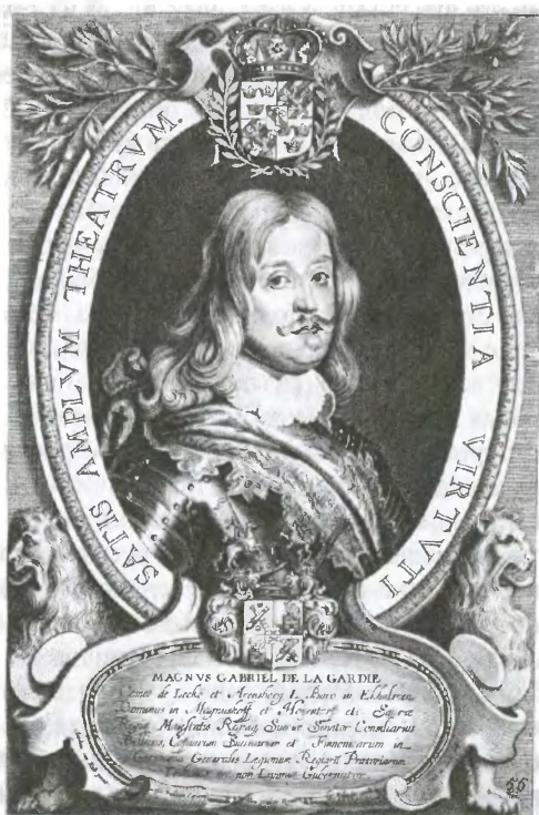
Магнус Габриэль Деллагарди, главнокомандующий шведских войск в Остзейских провинциях в 1655–1658 гг.

Гравюра по портрету маслом А. ван Хуле, 1717