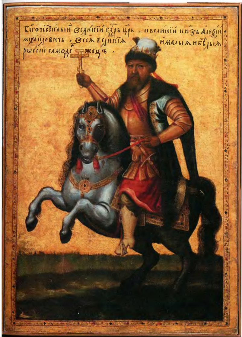
Конный портрет царя Алексея Михайловича. Мастер школы Оружейной палаты Московского Кремля, около 1675–1685 гг.