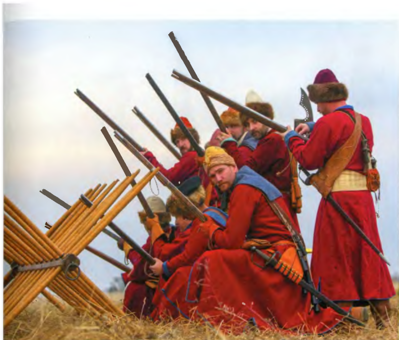
Стрельцы за рогатками. Современные реконструкторы.