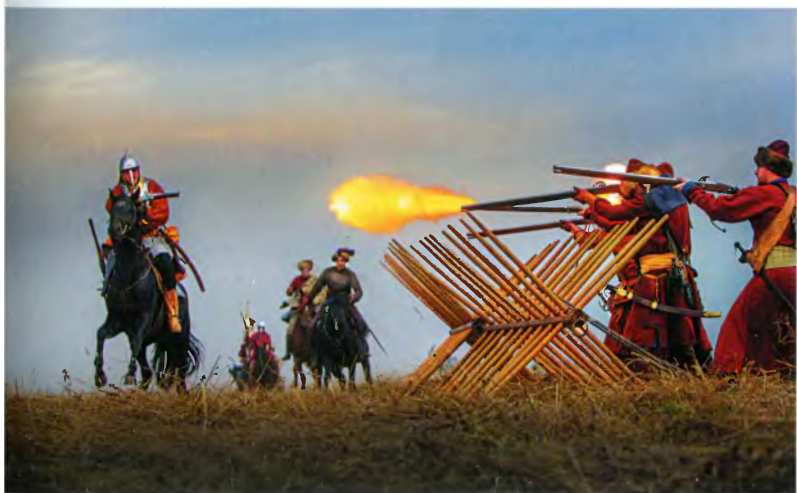
Бой рейтар с пехотой, прикрытой рогатками. Современная реконструкция, 2015