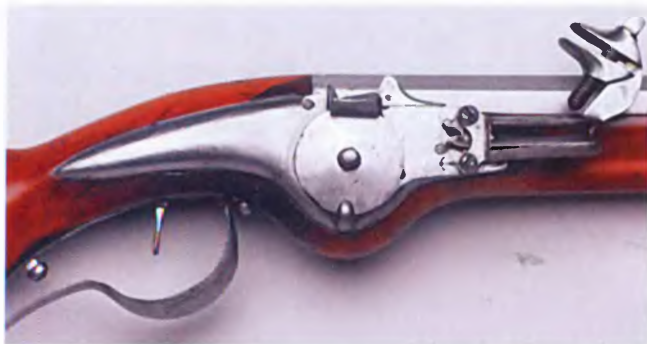
Кремневый замок карабина. Середина XVII в.