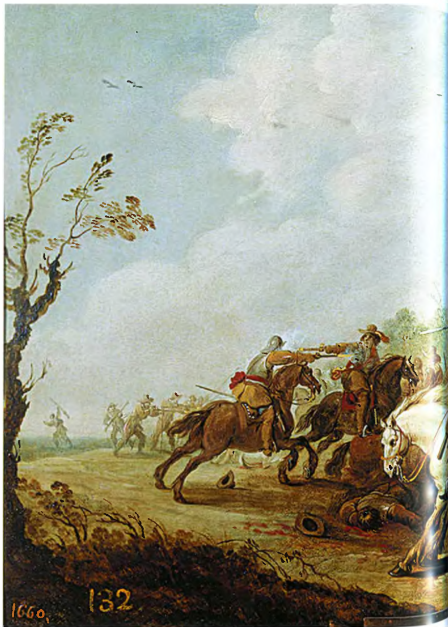
Удар кавалерии. П. Мёленер. Картина маслом на медной пластине, перв. пол. XVII в.