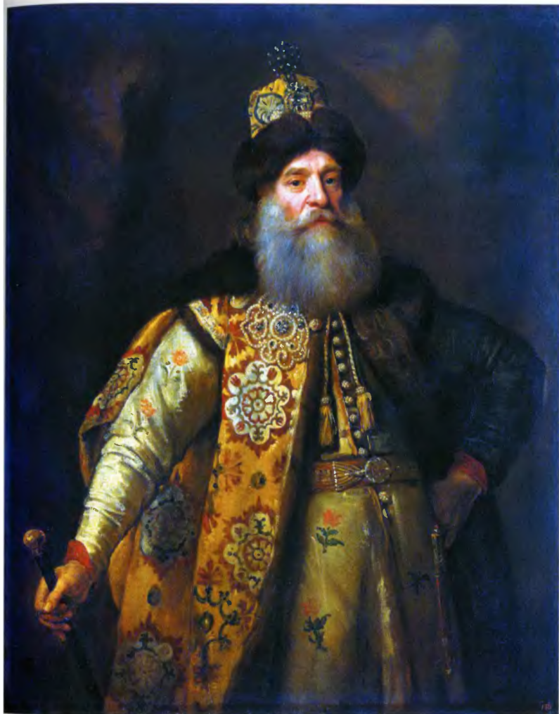
Петр Иванович Потемкин, в 1656 г. – стольник, воевода Лавуйского полка Новгородского разряда. Портрет маслом Г. Кнеллера, английского придворного портретиста, написан во время посольства Потемкина в Англию, 1675