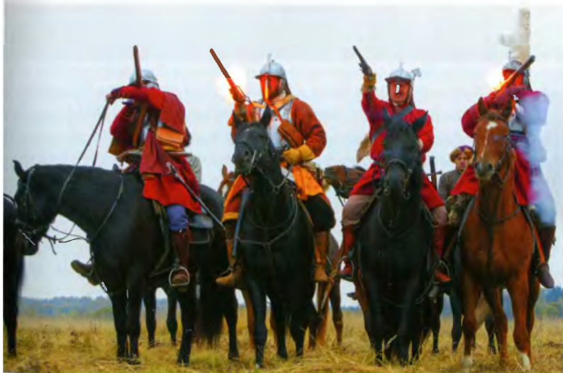
Русские рейтары стреляют с коня. Современная реконструкция, 2015