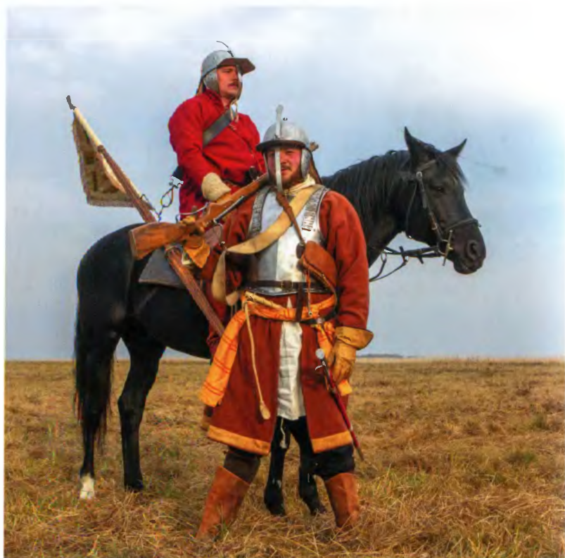
Рейтарский подпрапорщик с полковничьим знаменем (на коне) и пеший рейтар. Современная реконструкция, 2015