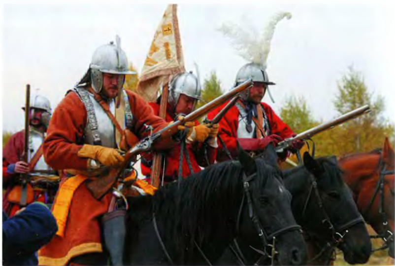
Рейгары заряжают карабины. Современная реконструкция, 2015