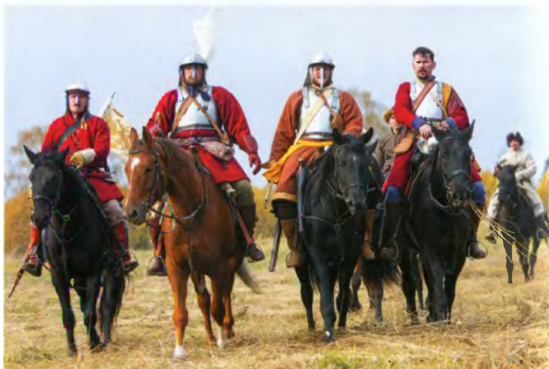
Строй русских рейтар в атаке. Современная реконструкция, 2015