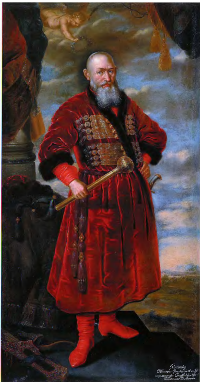
Стефан Чарнецкий, воевода Русский. Портрет маслом Б. Маттисена, 1659