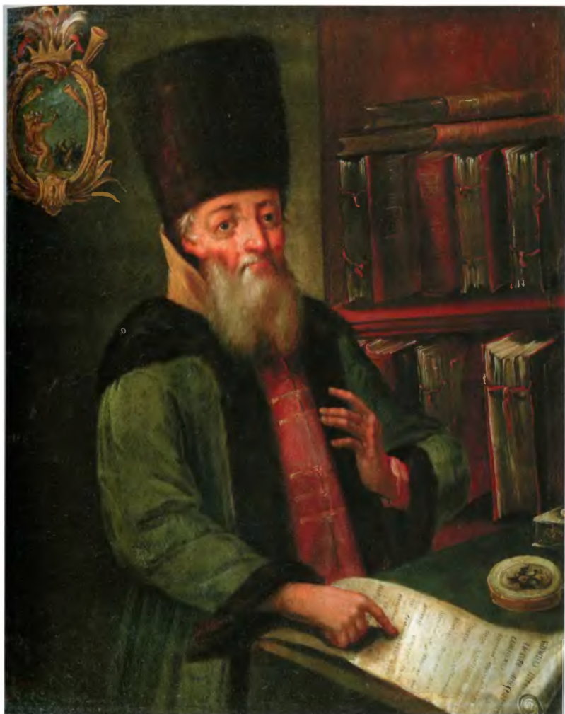
Афанасий Лаврентьевич Ордин-Нащокин. В 1658–1667 гг. думный дворянин, воевода Лифляндского полка (1658–1661), городской воевода Пскова (1665–1667).